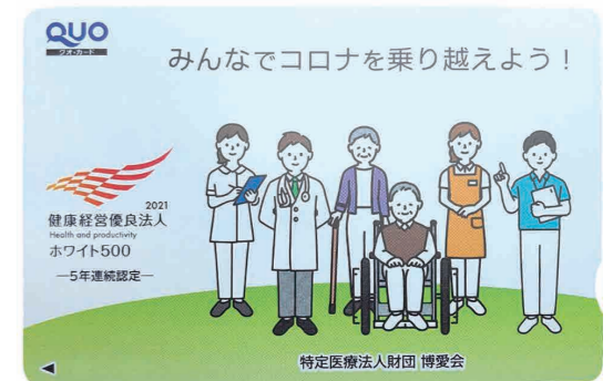
特定医療法人財団博愛会様から頂戴したクオカード

これからも水創りを通して、お客様の お役に立てますよう、社員一同精進し てまいります。