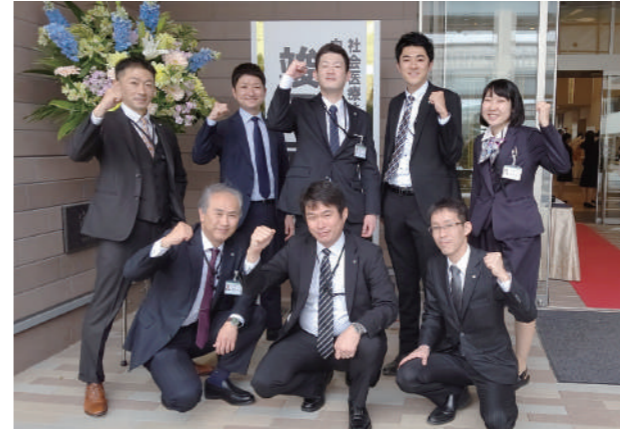
竣工時、福岡建築管理室の皆さま