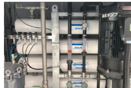
逆浸透膜プラント

対応してくださいました。本当に水が出るかわからないなかで責任をもつて最善を尽くしてくださったことを非常に感謝しております。通水後の費用対効果については、データなどを資料で提示してくださり効果を実感しています。またアフターフォローもしっかりしており、問い合わせに対してもすぐに対応してくれて、安心して水を創ってくれることを期待しています。