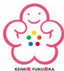
ふくおか健康づくり 県民運動ロゴマーク

健康づくり事業所として福岡県に登録されました。水の仕事は社会貢献という側面があると弊社は捉えています。働く従業員自身も健康で、幸せを感じながら働けるよう健康づくりに取り組んでまいります。