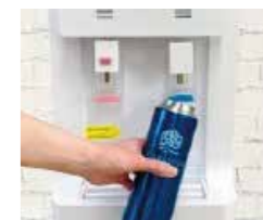
Mymizu 公式 Webサイト

浄水器ショールームを『Mymizu給水スポット』に登録しました。マイボトルを持参すれば、誰でも無料で給水できます。マイボトル運動を推進し、プラスチックごみの削減に貢献します。